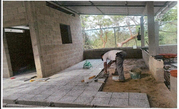
Foto 2: COLOCACIÓN DE PISO DE GRANITO AL AREA DE MEJORAMIENTO DE COCINA.